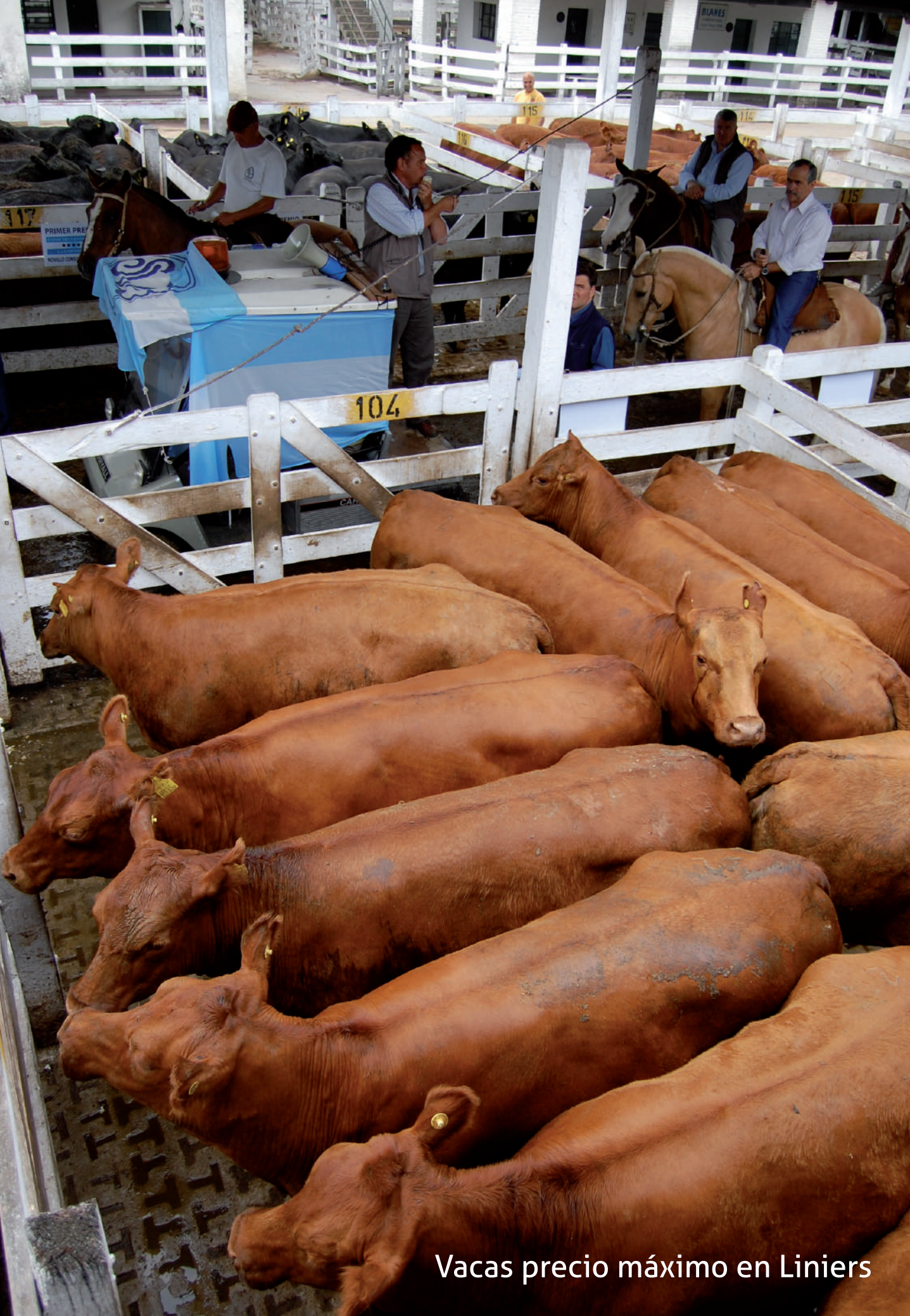
Vacas precio máximo en Liniers