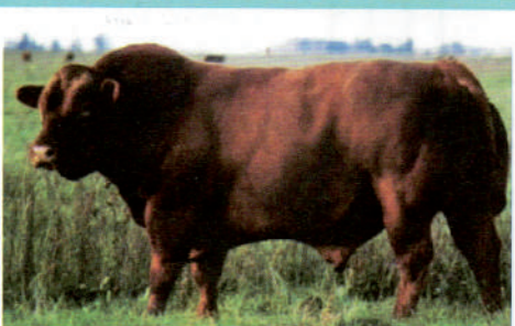
Chimpay 2002 CAPICUA

Las primeras crías obtenidas nos permiten ser optimistas respecto a este importante toro que reservamos para padre de nuestro plantel.