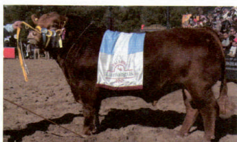
VENGADOR: GRAN CAMPEÓN PALERMO 2012

Ideal para trabajar con bajo frame manteniendo cualidades carniceras superiores y calidad.