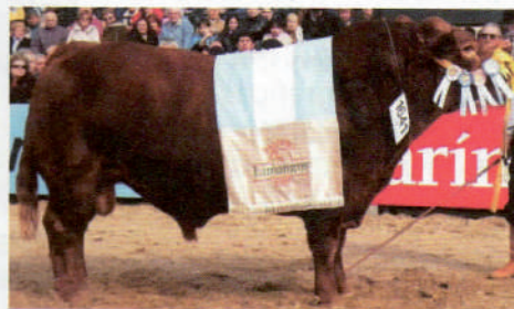
Chimpay Vasco 686 DIAMANTE

Diamante fue Campeón Macho en la exposición de Palermo 2007. Datos particulares N° de Registro: HBA 447 RP: 686 Fecha de Nacimiento: 27 Abril 2004 Altura de Cadera: 131 cm Peso al Nacer: ND Peso Adulto: 804 kg Circunferencia Escrotal: 38.5 cm Pedigree Padre: Chimpay 266 Madre: Chimpay 593